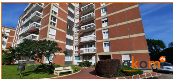
Entrée de la résidence